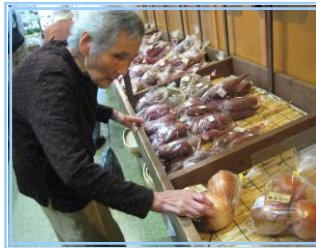
「今晚のおかず何しよ？」