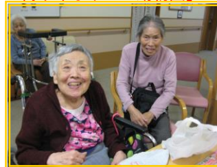
「懐かしいお友達に会いに…」