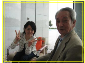
「優雅に大津プリンスホテル」