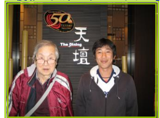
「焼肉食べたい！に、お応え。」