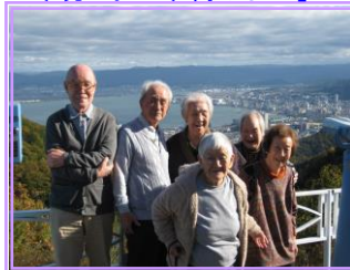
「比叡山ドライブウェイにて」