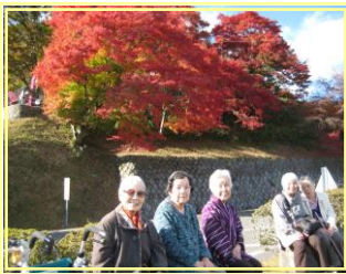
「比叡山の紅葉が最高！」