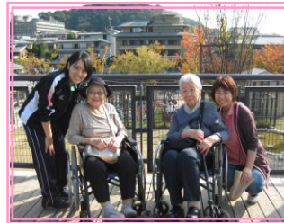
「何十年ぶり？の動物園」