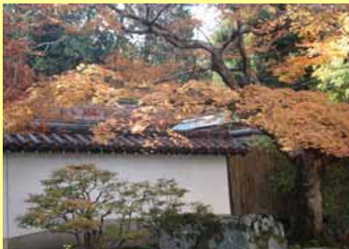
南禅寺の見事なお庭です 疎水公園でパチリ 是非また来年も行きましょうね！！

日ノ岡包括センターでは独自の事業として、毎月の筋トレ教室と年に 2 回の歴史ウオークを開催しておりますが、本年も 11 月 27 日に南禅寺まで行ってまいりました。当日は皆さんの日頃の積んで頂いている功德の賜物か晴天に恵まれました。ちょっとだけ写真で報告させていただきますね