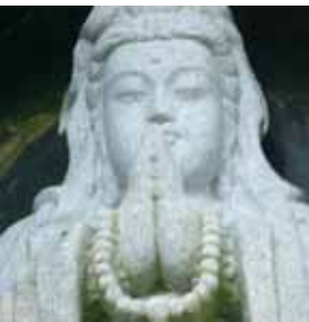
ありがたーい観音

今回は参加される方の脚力に合わせて長めのコースと短めのコースの二つを用意したのですが、どちらのコースに参加された方も一人掛けることなく皆さん無事に完歩されました。