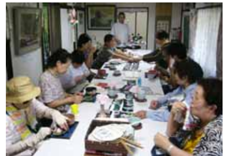
お抹茶とお菓子でホッと一息

最後は大乘寺さんでお抹茶と酔芙蓉の花を模ったお菓子を頂いたのですが、本当に見事な酔芙蓉の花でした。酔芙蓉とはその名のとおり朝方は白い花なのですが、段々お酒に酔ったようにうっすらと赤みを帯びてきて日が暮れる頃には紅色に染まるという種類の芙蓉です。